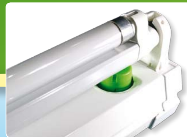
Die kompakte Bauweise der EnergySaver aus der SlimLine Gruppe ist sogar noch einfacher zu installieren.

Somit haben Sie alle Zahlen schwarz auf weiß.