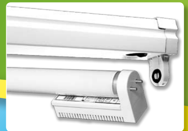
Sie können auch nur die Vorteile eines EVGs nutzen, indem Sie den EnergySaver für T8 einsetzen.