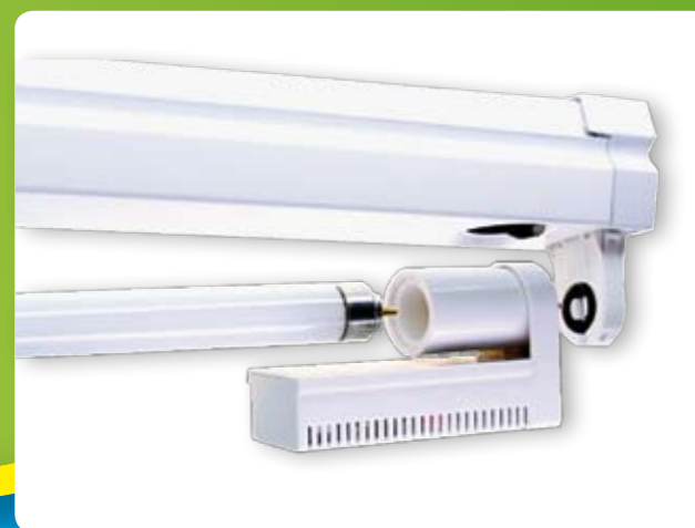
Einfache Installation bzw. Nachrüstung der vorhandenen Systeme durch die neuen EnergySaver Produkte.

Die Umrüstung ist wesentlich günstiger als eine komplette Neuinstallation von energiesparenden Leuchten und amortisiert sich dadurch viel schneller.